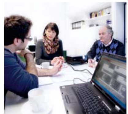
WÖHWA Ingenieur im Kundengespräch

Am Anfang einer Automatisierung steht immer eine angemessene Projektierung, um den Anforderungen und der Komplexität einer jeden Applikation gerecht zu werden. Jeder Kunde profitiert durch eine kompetente Beratung von WÖHWA Ingenieuren, die langjährige Erfahrung in der Automatisierung speziell von Schüttgutverladungen haben. Die individuellen Verladeabläufe eines jeden Kunden werden in der WÖHWA Automatisierungssoftware funktionssicher abgebildet. Jedes Gesamtsystem wird aus einzelnen robusten Hardwarekomponenten zusam-