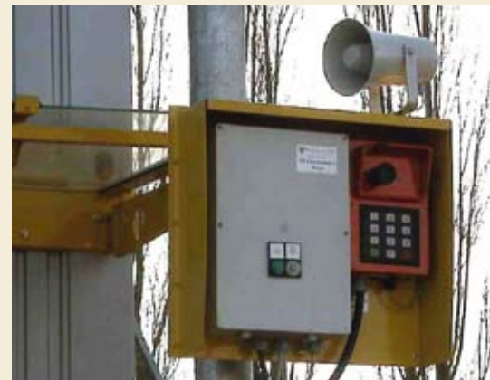
Transponder-Kartenleser mit Sprechanlage und Nebengeräuschunterdrückung