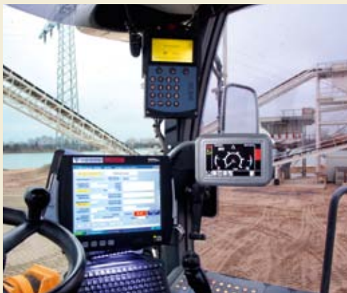
Radlagerterminal mit eichfähiger Radlagerwaage und Lieferscheindrucker

Um die Stillstandszeiten der Anlage auf ein Minimum zu reduzieren, werden alle wichtigen Anlagendaten und Eingaben im Hintergrund vom System PCS35 erfasst und archiviert, um entsprechende Fehleranalysen durchzuführen. Die Archivierung erfolgt im Netzwerk auf den entsprechenden Datenträgern oder kann manuell und schnell mit einem Memorystick erfolgen. Dies spart Zeit im Fehler- oder Havariefall und unter anderem auch in erheblichem Maße Montageeinsätze. Das System hält über das User Login im Hintergrund fest, wer was wann und wie gemacht hat und beugt somit Bedienfehlern vor.