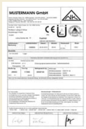
Vollgrafikfähiger Lieferscheinabdruck inkl. Gütesiegel

Radlader können mit WÖHWA Terminals (Anbindung über Wireless LAN oder USB-Stick) ausgestattet werden. Die Radladerfahrer werden mit Daten über die abzuwickelnden Verladungen aus dem Automatisierungssystem informiert. Die eichfähigen Radladerwaagen werden an die Terminals mit Lieferscheindruckern direkt angebunden, der Gewichtswert ausgedruckt und im Automatisierungssystem archiviert.