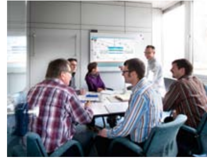
Schulung im WÖHWA Schulungszentrum