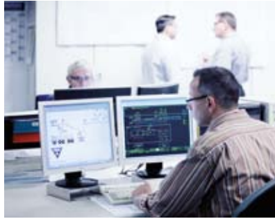
Planerstellung und Dokumentation in EPLAN