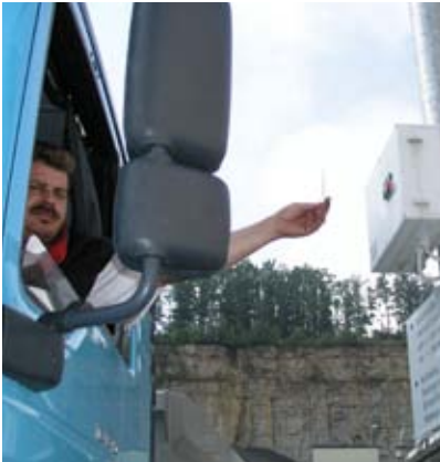
Selbstbedienung an Transponder-Kartenleser