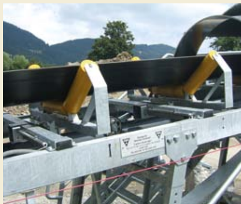
Eichfähige WÖHWA Bandwaage SFB 64e