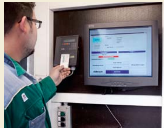
Selbstbedienterminal (Touchscreen) mit Transponder-Kartenleser