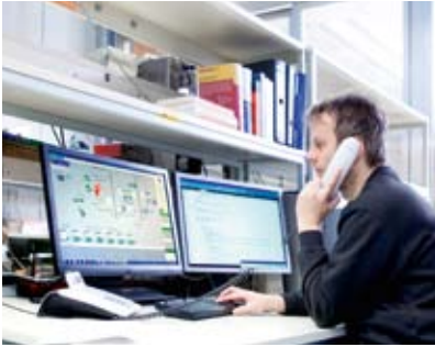
WÖHWA Servicemitarbeiter bei der Fernwartung