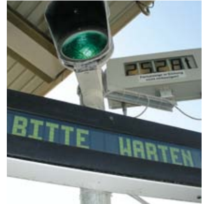
Numerische und alphanumerische Fernanzeige mit Ampel