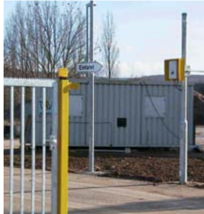
Werkzugang über Transponder-Kartenlesesystem