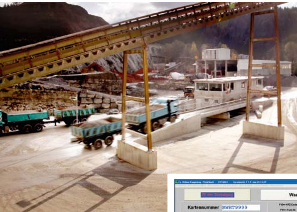
Zentraler Leitstand mit Ein-/Ausgangswaage