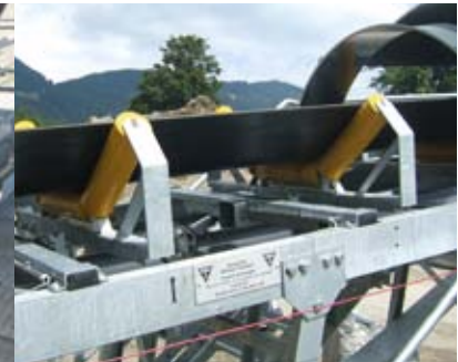
Bandwaage eichfähig (2 Rollenstühle)